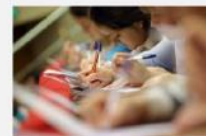
Отличникам "Тотального диктанта" подарят словари

Всероссийский правовой диктант организован по аналогии с "Тотальным диктантом", но проверяется юридическая грамотность. Чтобы облегчить участникам задачу, проводится он в виде теста.